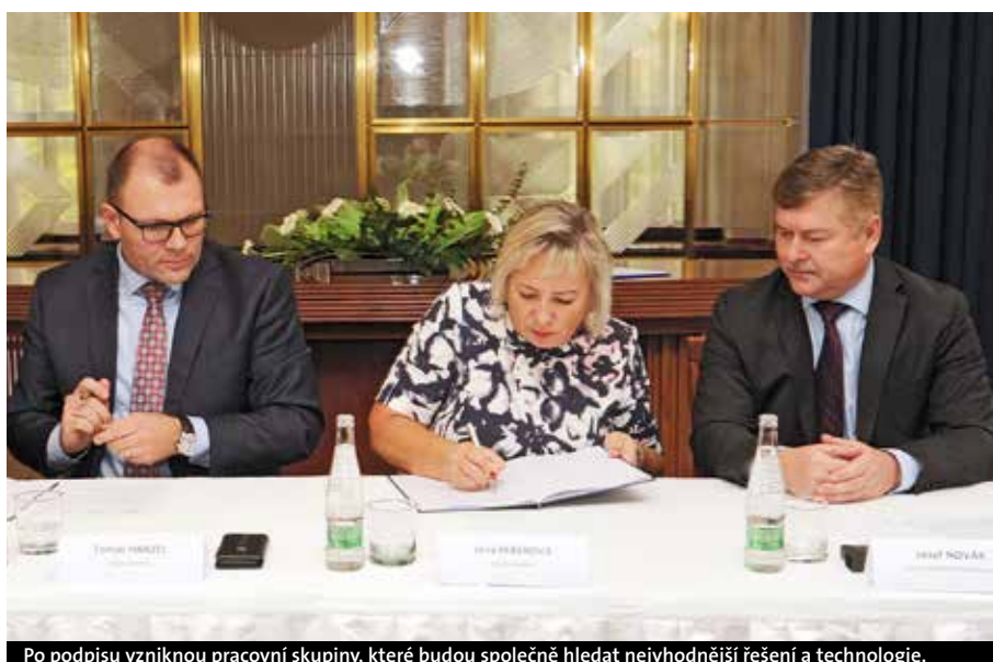
Po podpisu vzniknou pracovní skupiny, které budou společně hledat nejvhodnější řešení a technologie.

Obě města motivují své občany ke třídění odpadů, to však do budoucna nestačí. „V současné době v našem regionu nemáme komplexní řešení pro nakládání s odpady, které by odpovídalo budoucím povinnostem měst a obcí. Chceme být připraveni a včas vybudovat potřebné technologie a tím ochránit obyvatele před vysokými platbami