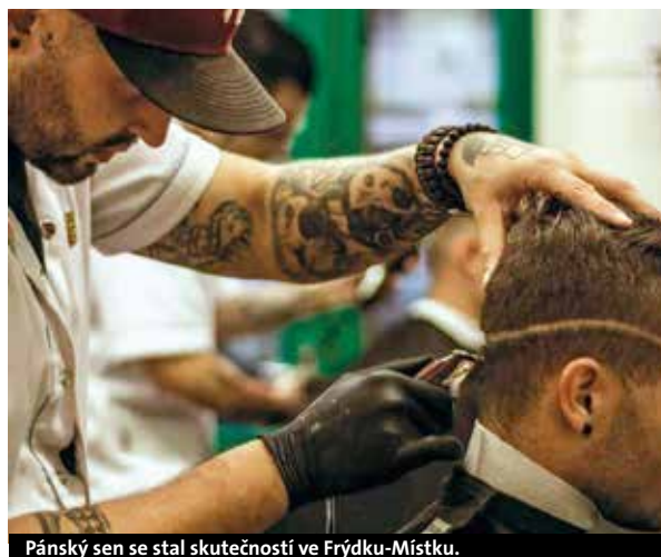
Pánský sen se stal skutečností ve Frýdku-Místku.

V rámci chráněné dílny Dobrý domov byla vytvořena celkem čtyři pracovní místa pro osoby s tělesným posti-