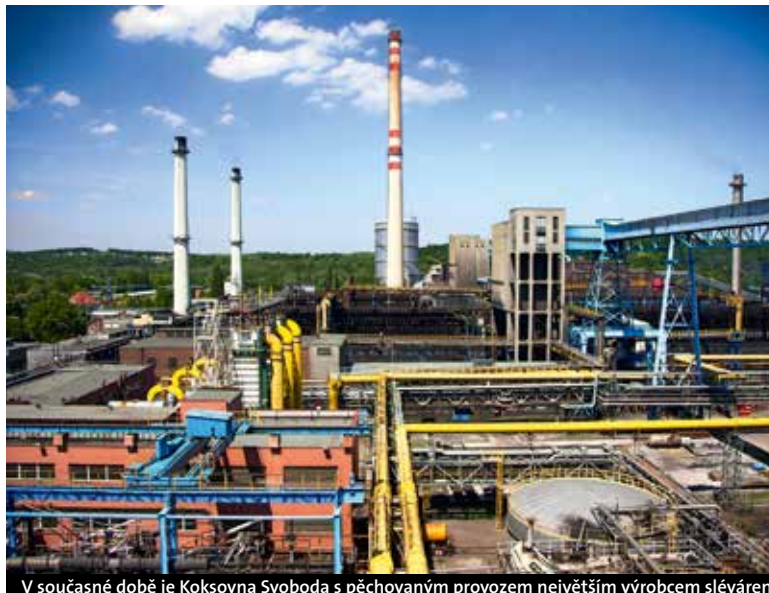
V současné době je Koksovna Svoboda s pýchovaným provozem největším výrobcem slévárenského koksu v Evropě.

Na čtyřech koksárenských bateriích v Koksovně Svobo-