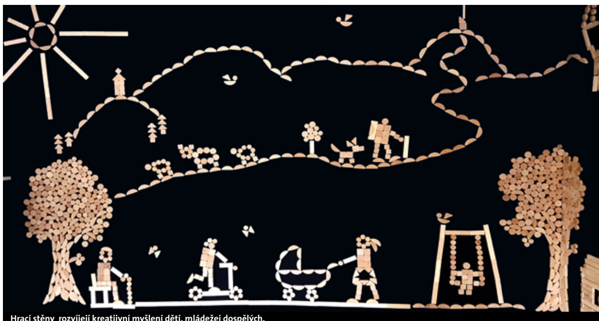
Hrací stěny rozvíjejí kreativní myšlení dětí, mládeže i dospělých.

VENDULA VALENTOVÁ, ŘEDITELKA NADAČNÍHO FONDU VEOLIA