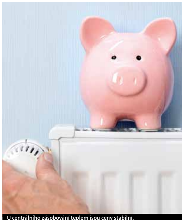
U centrálního zásobování teplem jsou ceny stabilní.

„Dle dostupných informací by měl být tedy i letošek vel-