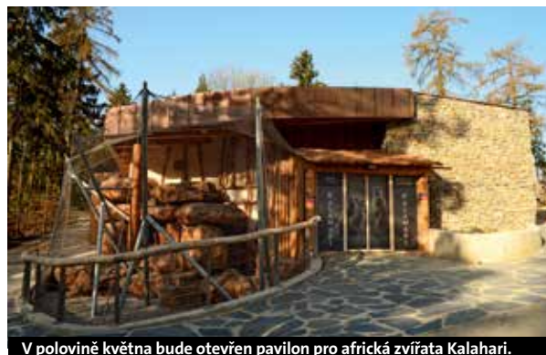
V polovině května bude otevřen pavilon pro africká zvířata Kalahari.