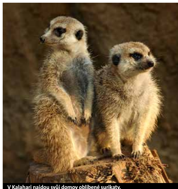
V Kalahari najdou svůj domov oblíbené surikaty.