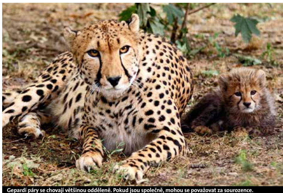
Gepardí páry se chovají většinou odděleně. Pokud jsou společně, mohou se považovat za sourozence.

• Do zoo se z centra Olomouce dostanete autobusem za 20 minut.