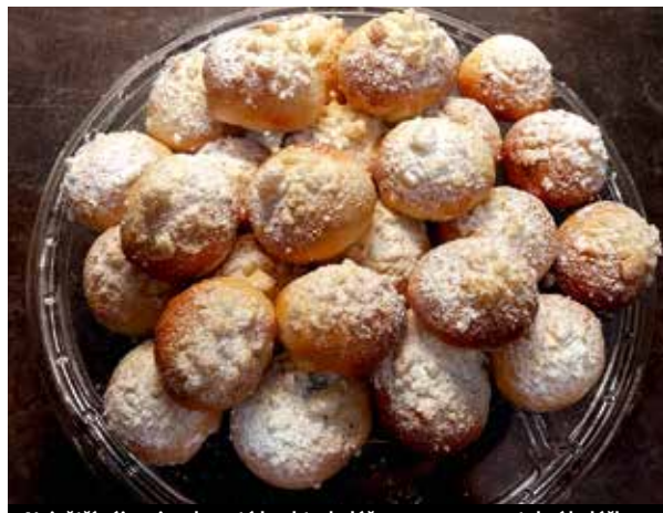
Největší zájem je o kynuté buchty, koláče s ovocem a svatební koláčky.