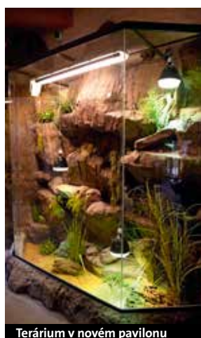
Terárium v novém pavilonu

LV: Toto už není moje parkeť. Omlouvám se, ale musím odejít na spojování zvířat.