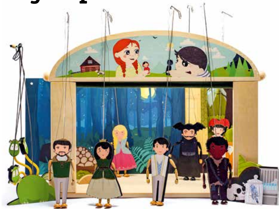
Originální loutková divadla slaví úspěch dokonce i v zahraničí.